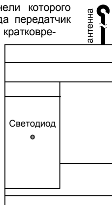
Рис. 1. Внешний вид передатчика

Дальнейшая проверка передатчика проводится с внешним охраняемым оборудованием, предназначенным для работы с передатчиком, как описано в эксплуатационной документации на это оборудование.