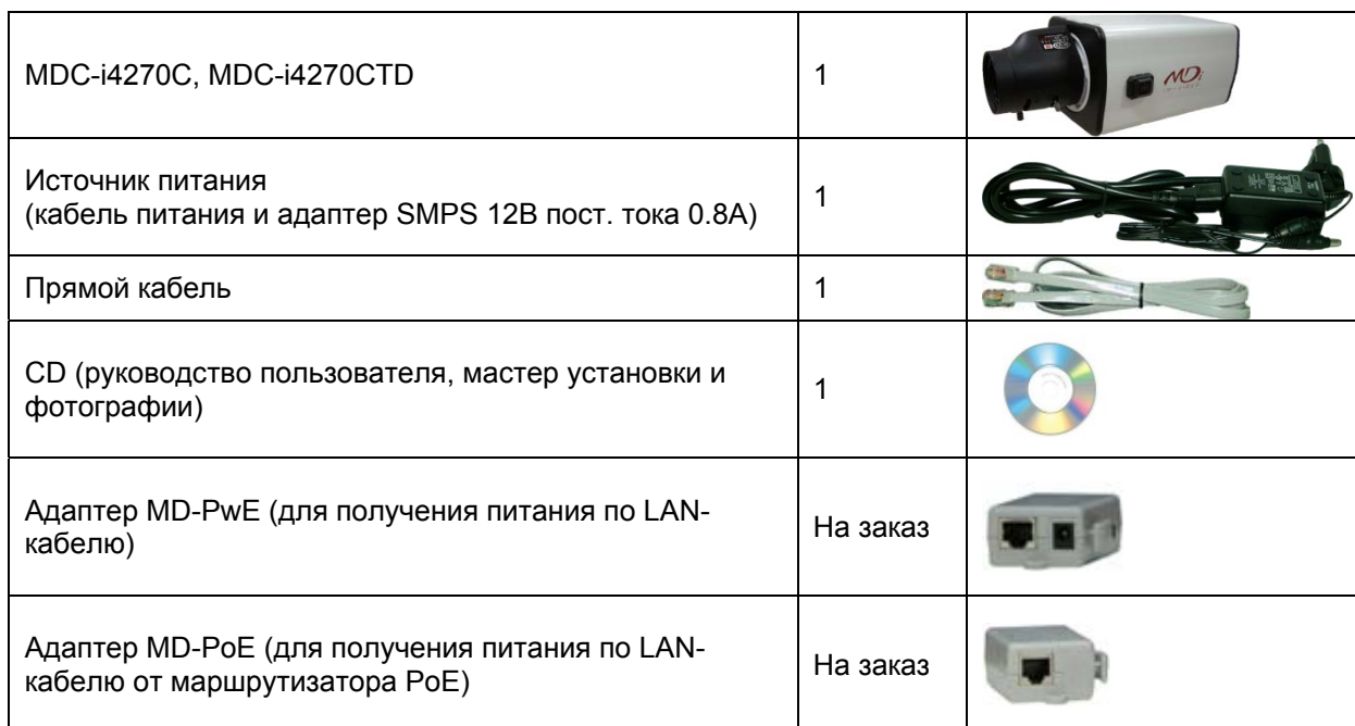
Таблица 2. Упаковочный лист MDC-i4270C, MDC-i4270CTD

В комплект MDC-i4270C, MDC-i4270CTD входят части, перечисленные ниже