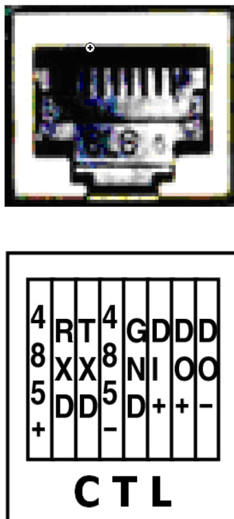
Рисунок 4. Описание порта CTL

С целью подключения RS-232 для устройства последовательного ввода, модема или консоли (программа связи) используются RXD, TXD и GND. Для подключения к ПК используются RXD и TXD – кросс-кабели.