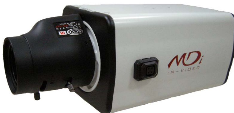
Рисунок 1. MDC-i4270C, MDC-i4270CTD

MDC-i4270C, MDC-i4270CTD поддерживает NTSC/PAL, 5 различных размеров и 6 уровней качества видео изображения.