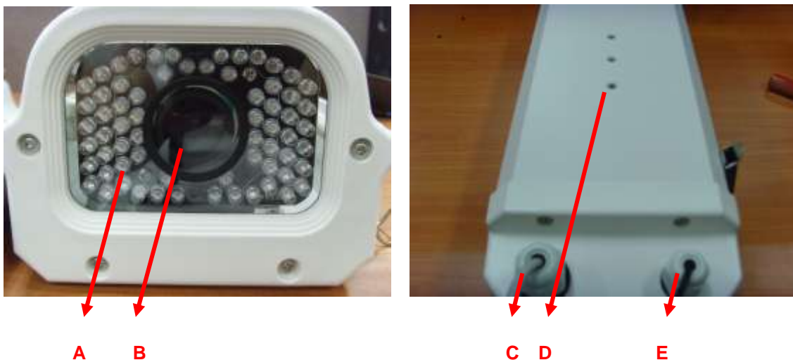
Рисунок 2. Лицевая и задняя панель MDC-i6291VTD-66H