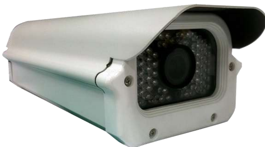
Рисунок 1. MDC-i6291VTD-66H

MDC-i6291VTD-66H может передавать до 30 кадров в секунду (1280x720) посредством существующей сети, такой как LAN, выделенные линии, DSL и кабельный модем. Можно отслеживать видео, поступающее с MDC-i6291VTD-66H, с помощью веб-браузера при подключении MDC-i6291VTD-66H к сети. MDC-i6291VTD-66H поддерживает видеосжатие, Motion-JPEG и H.264 одновременно, так что пользователь может выбрать нужный тип видеосжатия.