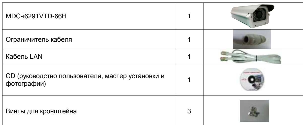
Таблица 1. Комплектация MDC-i6291VTD-66H

В комплект MDC-i6291VTD-66H входят части, перечисленные ниже.