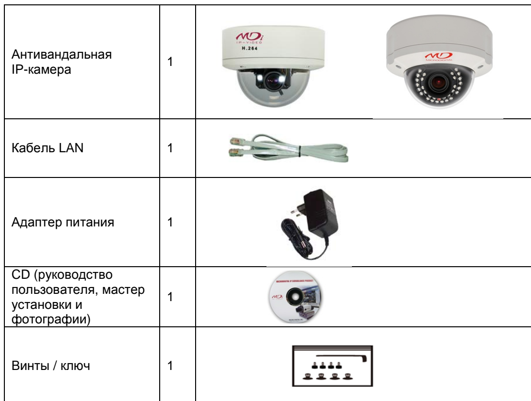
Таблица 5. Комплектация

В комплект входят части, перечисленные ниже.