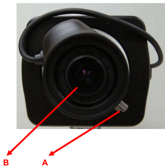
Рисунок 2. Вид спереди MDC-i4250C, MDC-i4250CTD