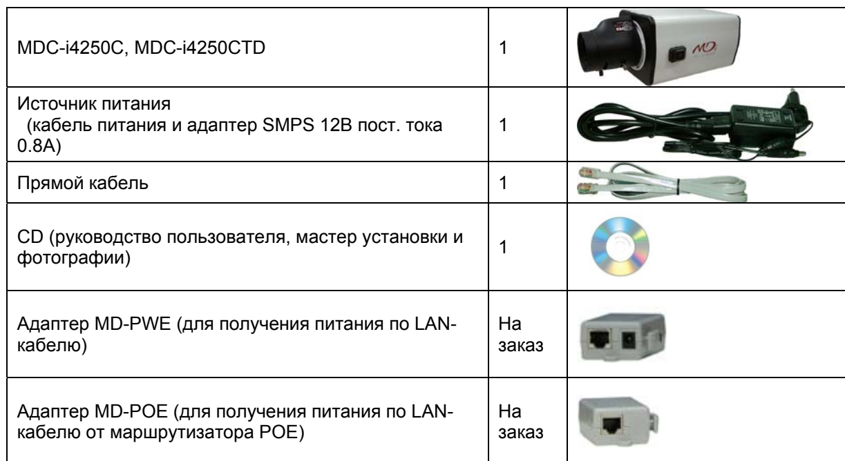
Таблица 2. Упаковочный лист MDC-i4250C, MDC-i4250CTD

В комплект MDC-i4250C, MDC-i4250CTD входят части, перечисленные ниже.